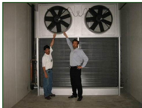
EVAPORADOR TUNEL DE CONGELADO