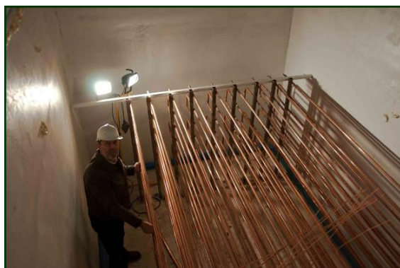
SERPENTIN BANCO DE HIELO