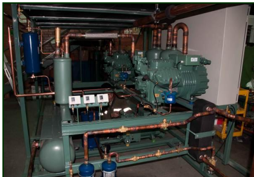
TANDEM MOTOCOMPRESORES CHILLER