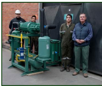
UNIDAD TIPO TORNILLO