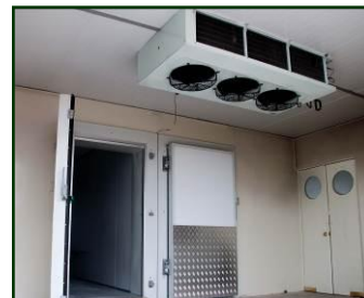
PUERTAS Y PLAFONIER